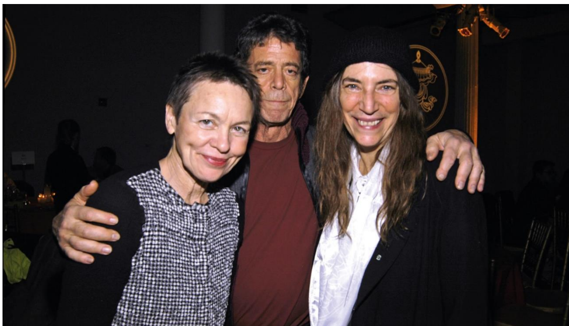
Nueva York los crea y el arte (y la música) los junta. Laurie Anderson, Lou Reed y Patti Smith en el concierto benéfico para la organización Tibet House, Nueva York, 26 de febrero de 2007.

Como a Picasso y a Kahlo, como a Borges y a Plath, como a Chanel y a Westwood, como a Varda y a Kubrick, a The Velvet Underground hay que estudiarlos. Avanzaron temas y cuestiones que iban contracorriente, pero que hoy siguen estando vigentes. Fueron originales, genuinos.