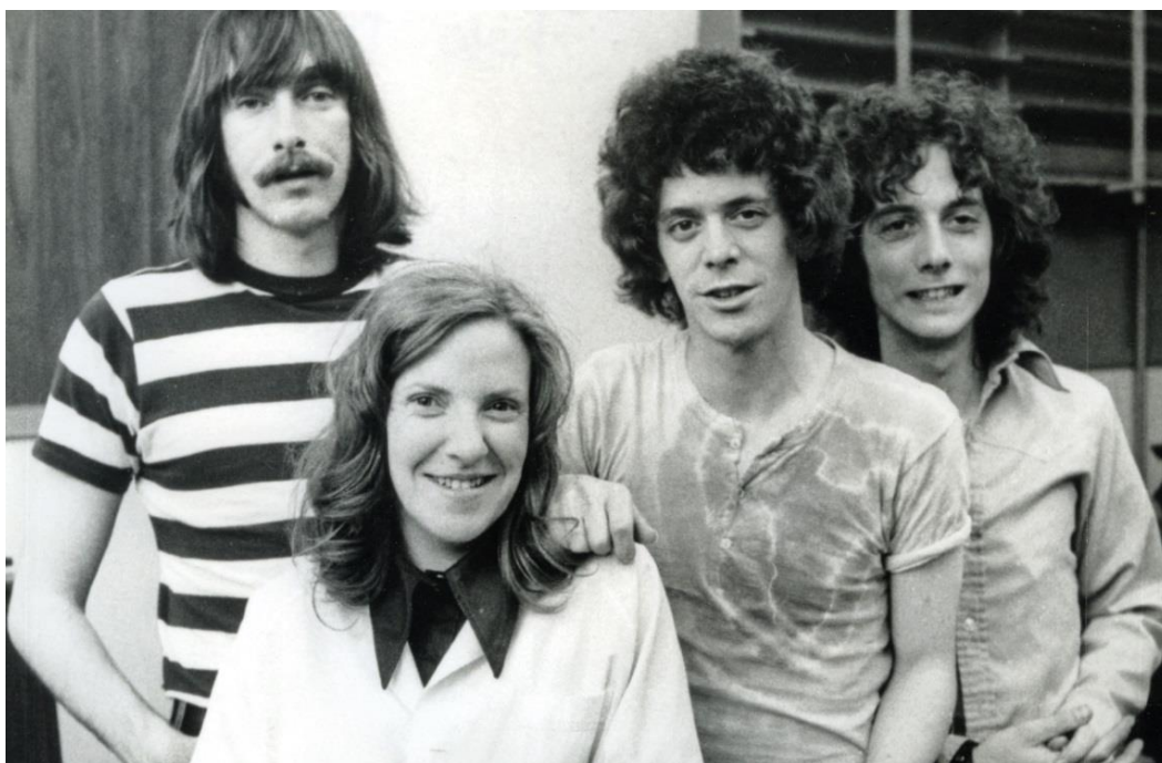
Cuando las grietas definitivas aún no habían aparecido. Sterling Morrison, Moe Tucker, Lou Reed y Doug Yule, o lo es que es lo mismo, la formación de The Velvet Underground que actuó y grabó durante 1969 y parte de 1970.

aclearar, lo que buscaban era provocar, confundir, hacer un corte de mangas al mundo en general. Sus declaraciones están plagadas de mentiras usadas como armas y, por eso mismo, son pasto de la contradicción. Cualquier esfuerzo para reconstruir, a mi manera, la historia del grupo que me hizo querer contar, que me ayudó a ser, merecía la pena. Un grupo cuyo nombre completo se repite una y otra vez en las páginas siguientes. A The Velvet Underground me gusta tratarlos de usted. Al narrar su historia estoy hablando de asuntos que también me definen a mí. Y eso significa que, al igual que en aquella canción de Lou Reed, todas las cosas en las que creía han terminado siendo verdad. Una verdad que empieza exactamente aquí.»